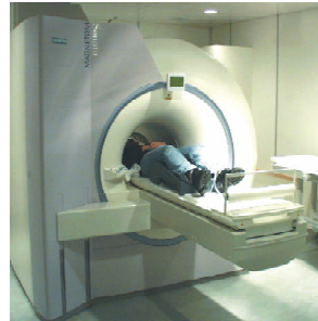
Funktionelle Magnetresonanztomographie (fMRT):

Die dabei gewonnenen Erkenntnisse erlangten unmittelbare Bedeutung für die klinische Versorgung von Kindern, bei denen wegen schwerer Epilepsien operative Eingriffe am Gehirn durchgeführt werden müssen.